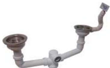
CESTO INOX AVS