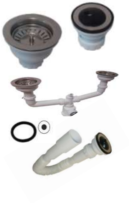
Tabela de Preços