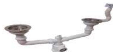
CESTO INOX AVS